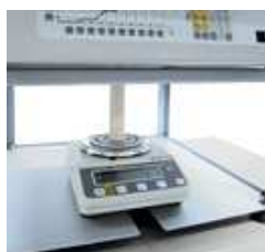
4 bilance di portata massima varia e intervalli di misurazione selezionabili