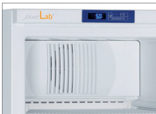
Pannello di controllo dei modelli ET 2721 / 2723 / 4021 / 4023