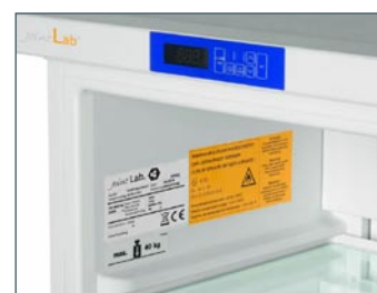
Display MLV 2721C