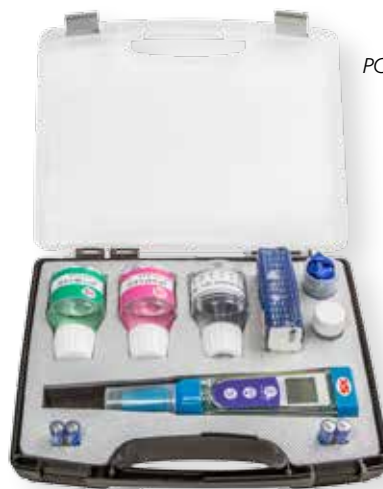
PC 5 kit