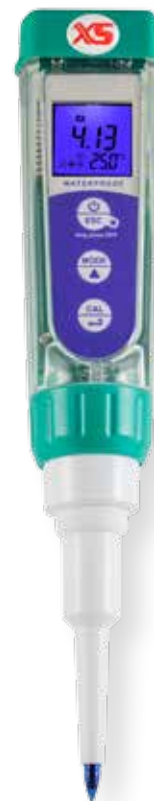
pH 5 FOOD