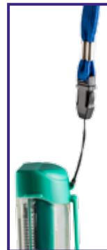
Cordino da collo