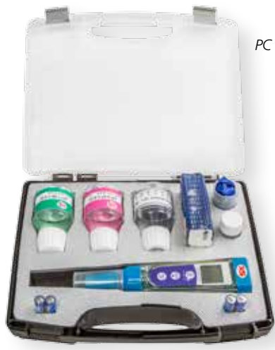
PC 5 kit