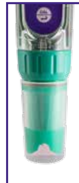
Cappuccio di protezione utilizzabile come becker di calibrazione