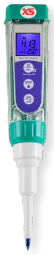
pH 5 FOOD