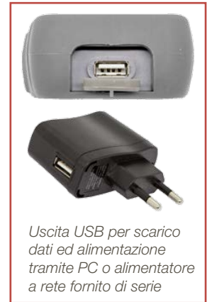
Uscita USB per scarico dati ed alimentazione tramite PC o alimentatore a rete fornito di serie

Se usato in abbinamento con la sonda PT56L 1/5 DIN è ideale come strumento primario