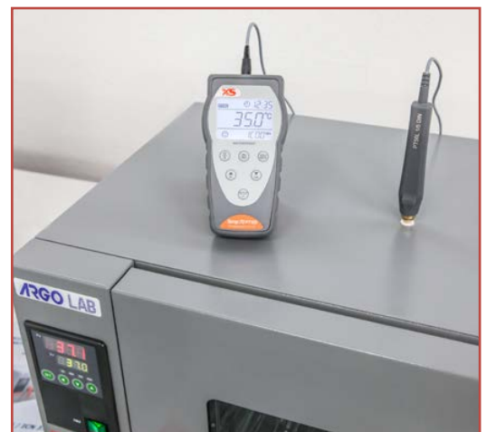
Controllo della temperatura di un incubatore