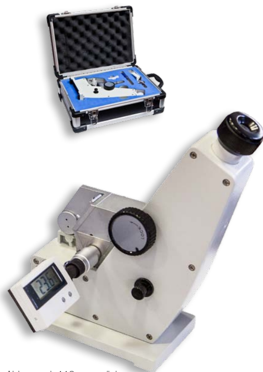
Abbe mod. 110 con valigia di trasporto