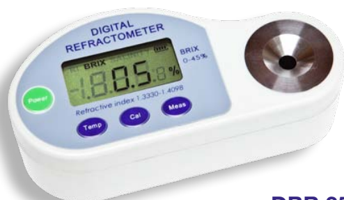
DBR 35 DBR 45 DBR Salt

DBR la serie di rifrattometri a lettura digitale ideale per il laboratorio e la produzione. Semplici da usare, basta una goccia di campione sul prisma di lettura e sul display comparirà la concentrazione, basta con scale ottiche di difficile valutazione. Adatti anche con campioni torbidi o colorati.