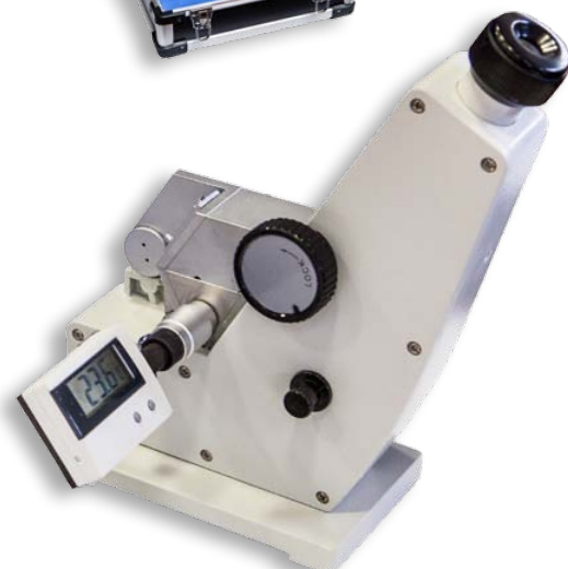
Abbe mod. 110 con valigia di trasporto