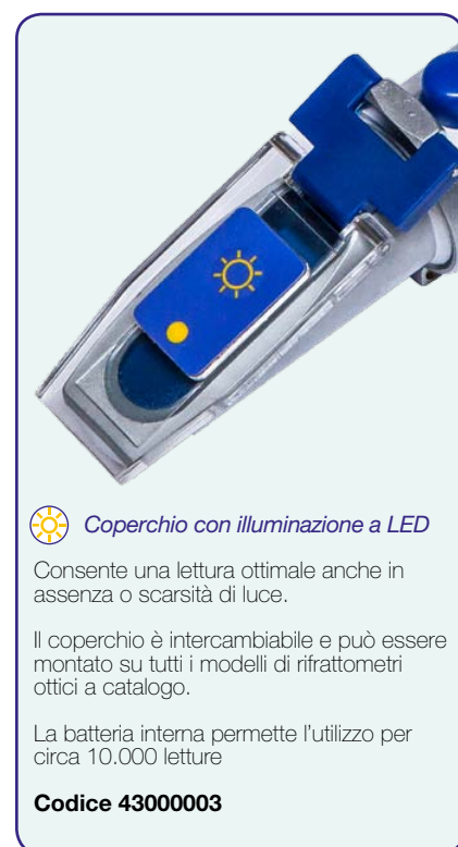
Coperchio con illuminazione a LED

Codice 43000043 - coperchio senza illuminazione