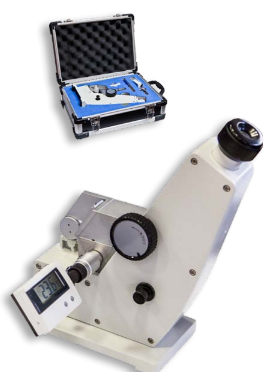
Abbe mod. 110 con valigia di trasporto